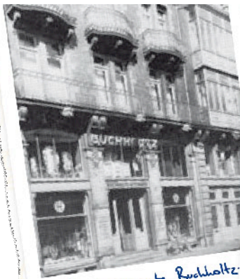
Établissements Buchholtz-Ettinger - 1900