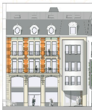
Résidence "ART NOUVEAU"