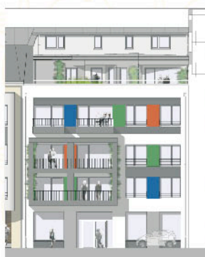
Résidence "POP ART"