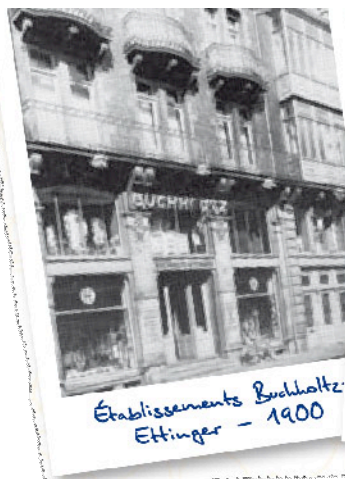
Établissements Buchholtz Ettinger - 1900