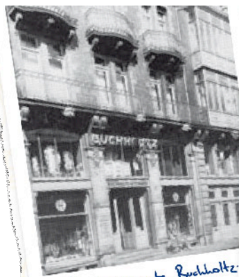
Établissements Buchholtz Ettinger - 1900